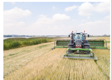
With Valtra Guide