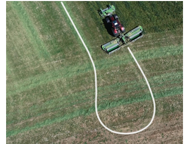
Skip Pass - Avec A-G